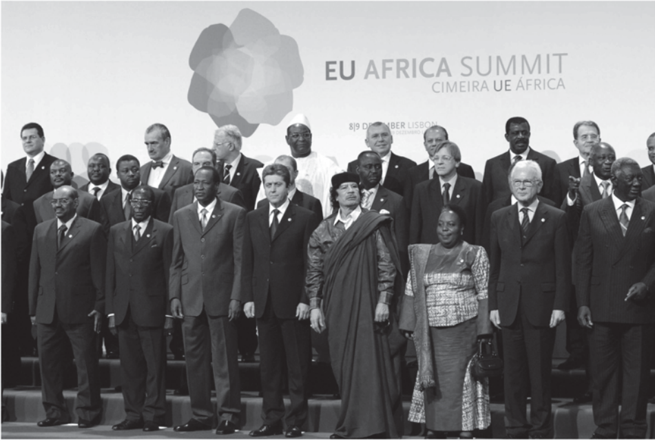
القادة الإفريقيون والأوروبيون في قمة الاتحاد الأوروبي- إفريقيا، لشبونة، ديسمبر 2007

الدول الأعضاء في الاتحاد الأوروبي مثل بريطانيا وفرنسا بمقاعدتها الدائمة في مجلس الأمن التابع للأمم المتحدة، هما بالفعل ممثلين دبلوماسيين بشأن قضايا أمنية دولية مثلما يقوم الاتحاد الأوروبي نفسه بعملية ، وفي عام 1999، استحدث الاتحاد الأوروبي منصب المسئول الأعلى لشئون السياسة الأمنية والخارجية المشتركة (والتي قامت حتى وقت كتابة هذا الكتاب بقيادة خافيير سولانا) كي يمثل مجلس الاتحاد الأوروبي لشئون السياسة الخارجية الخاصة بالاتحاد الأوروبي وكي يقوم بإجراء مفاوضات بالنيابة عن المجلس.